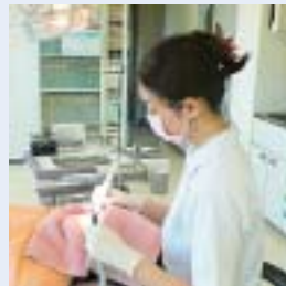
口腔内クリーニング・歯石除去