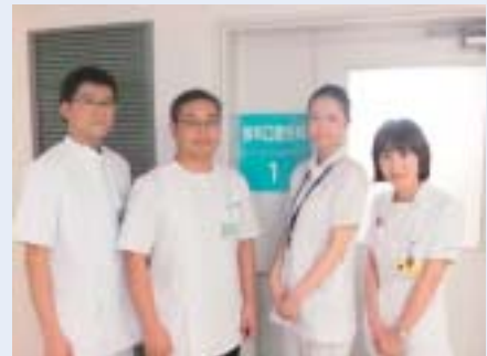
左から 吉川先生、秦先生、江戸衛生士、伊勢看護師