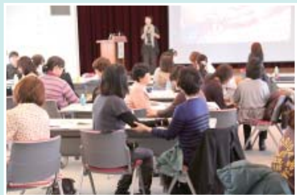
コミュニケーション実習風景